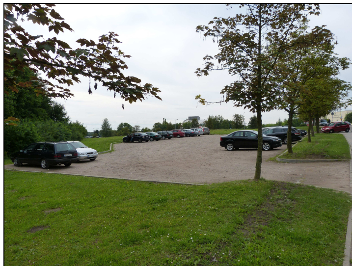
2. Projektowany teren 01UO - widok od strony NW, od ul. Oczapowskiego