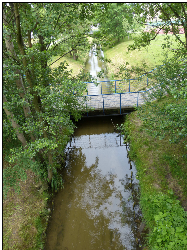
4. Dla porównania - Kortówka powyżej mostku na ul. Dybowskiego - całkowicie uregulowana