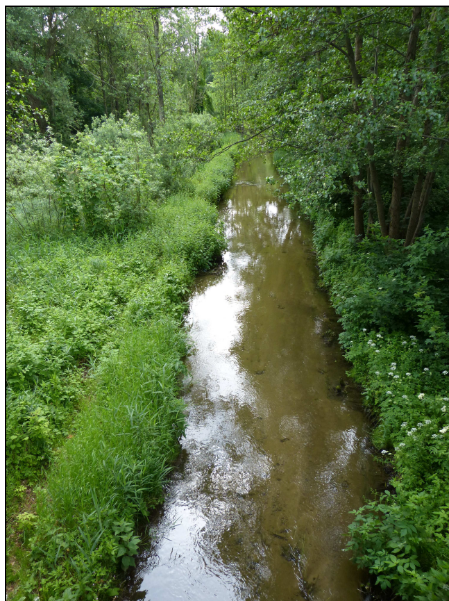
3. Rzeka Kortówka - teren 20Wp wraz z przyległymi terenami 04ZN (po lewej) i 05ZN (po prawej)