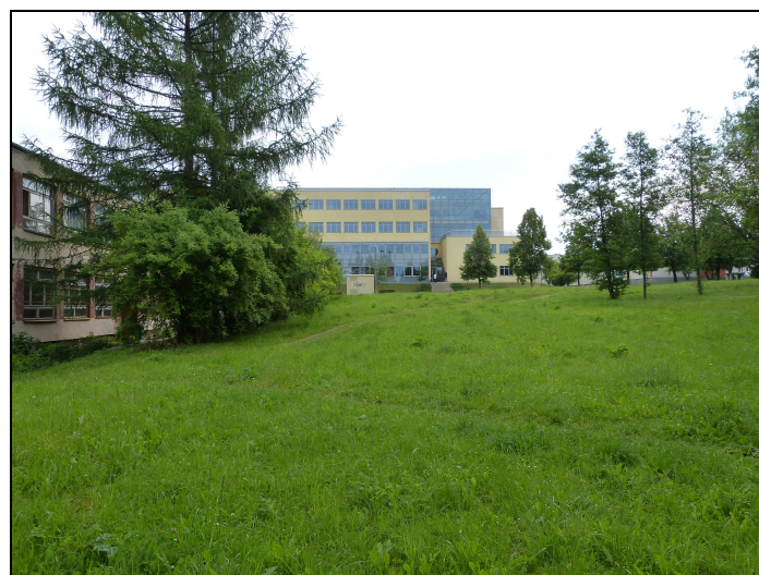
8. Projektowany teren 03UO - widok od strony SW