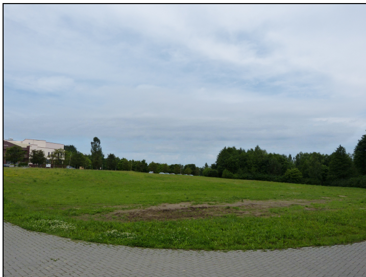
1. Projektowany teren 01UO - widok od strony SE, od strony skrzyżowania ul. Dybowskiego z al. Warszawską