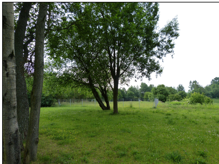
12. Projektowany teren 14KS - widok od strony N. Widoczne wyгородzenie terenu z instalacją sanitarną do likwidacji