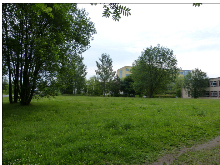
7. Projektowany teren 03UO - widok od strony N