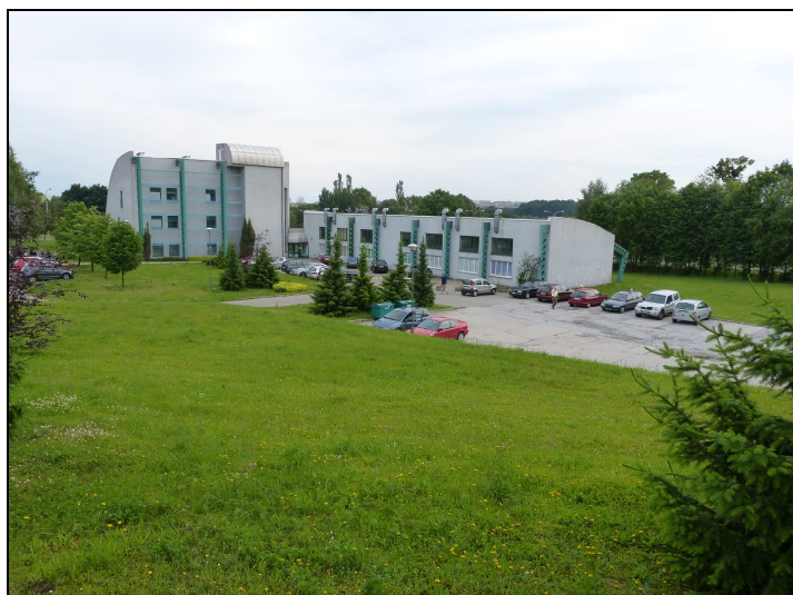
5. Projektowany teren 02UO - widok od strony SW