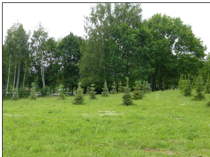
6. Projektowany teren 07ZI - widok od strony N