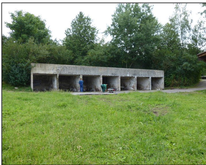
13. Projektowany teren 10NO/ZU - obecnie obiekt do gromadzenia obornika