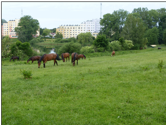
11. Projektowany teren 09ZU - widok od strony SE. W tle widoczna zabudowa zlewni Jez. Starodworskiego po stronie NW