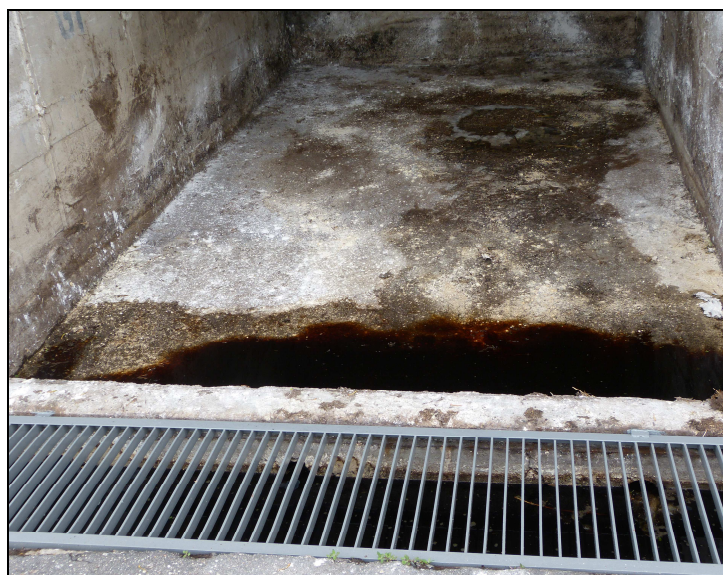
14. Projektowany teren 10NO/ZU - sposób odprowadzenia odcieków z kwatery w obiekcie do gromadzenia obornika