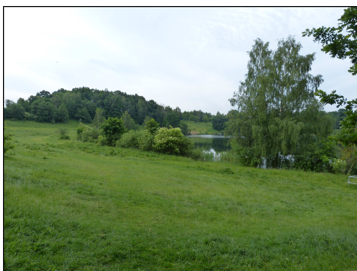
9. Projektowany teren 09ZU - widok od strony NE