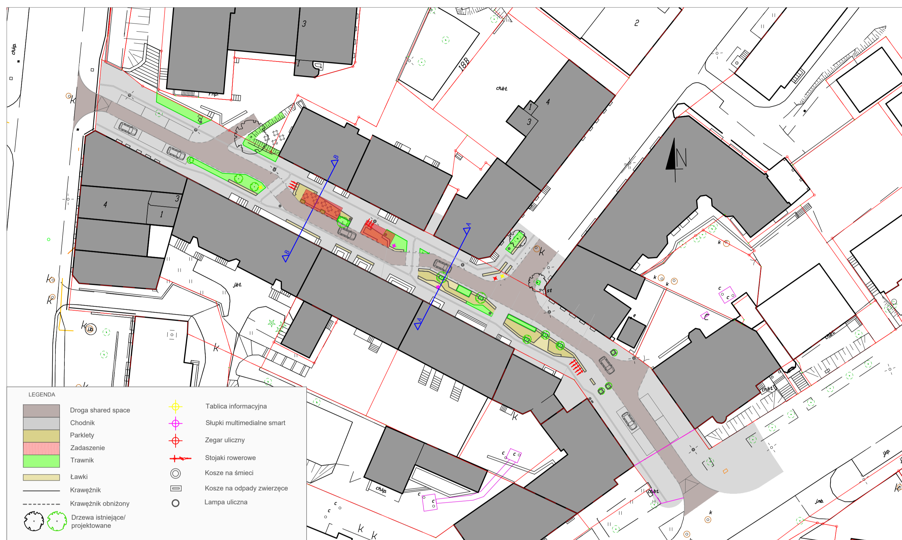
Plan sytuacyjny w skali 1:500

Inaczej „ulica do mieszkania”, woonerf oferuje kameralną, przyjazną atmosferę sprzyjającą integracji mieszkańców. Uspokojenie ruchu kołowego do minimum m.in. poprzez parkingi buforowe oddaje tę przestrzeń ludziom na wypoczynek i spotkania. Parklety miejskie stanowią wielofunkcyjne uliczne umeblowanie- miejsce do siedzenia, leżania, odstawienia roweru czy zjedzeniu posiłku, zróżnicowane formy parkletów pozwalają na korzystanie z nich zarówno przez dzieci jak i osoby z niepełnosprawnościami. Ofertę ulicy poszerzają słupy multimedialne pozwalające posłuchać muzyki, doładować telefon czy korzystać z internetu.