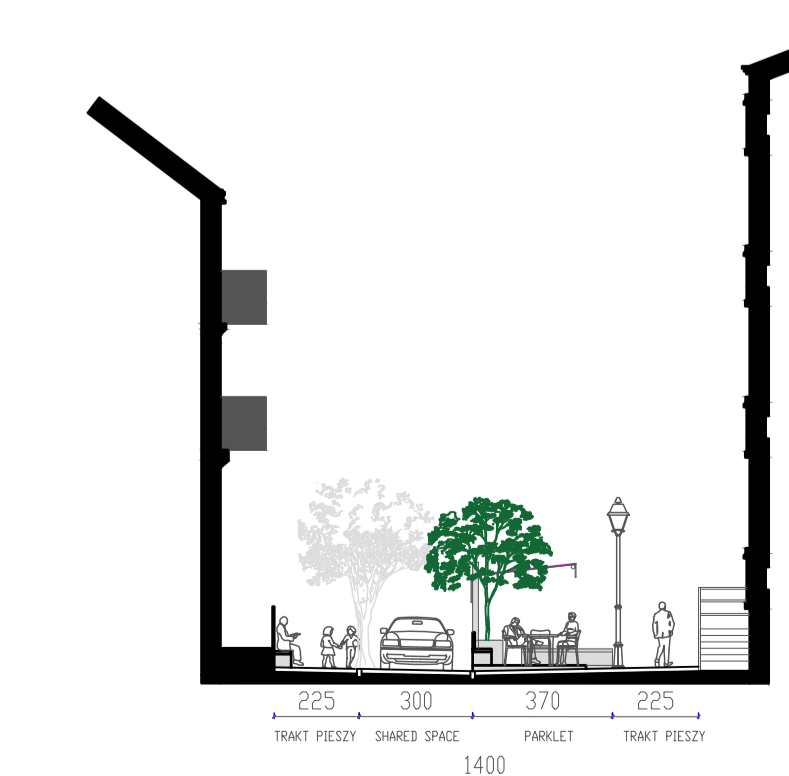
Przekrój B-B w skali 1:200