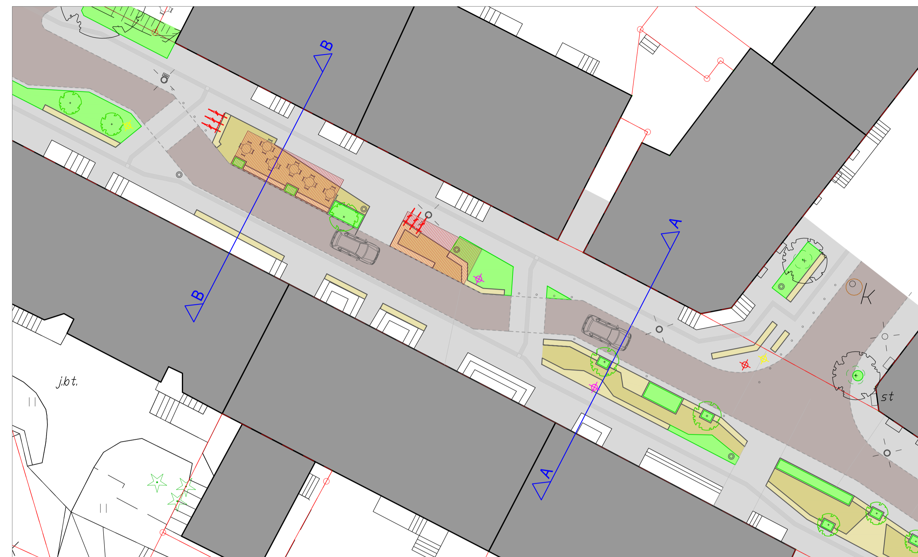
Plan sytuacyjny w skali 1:200