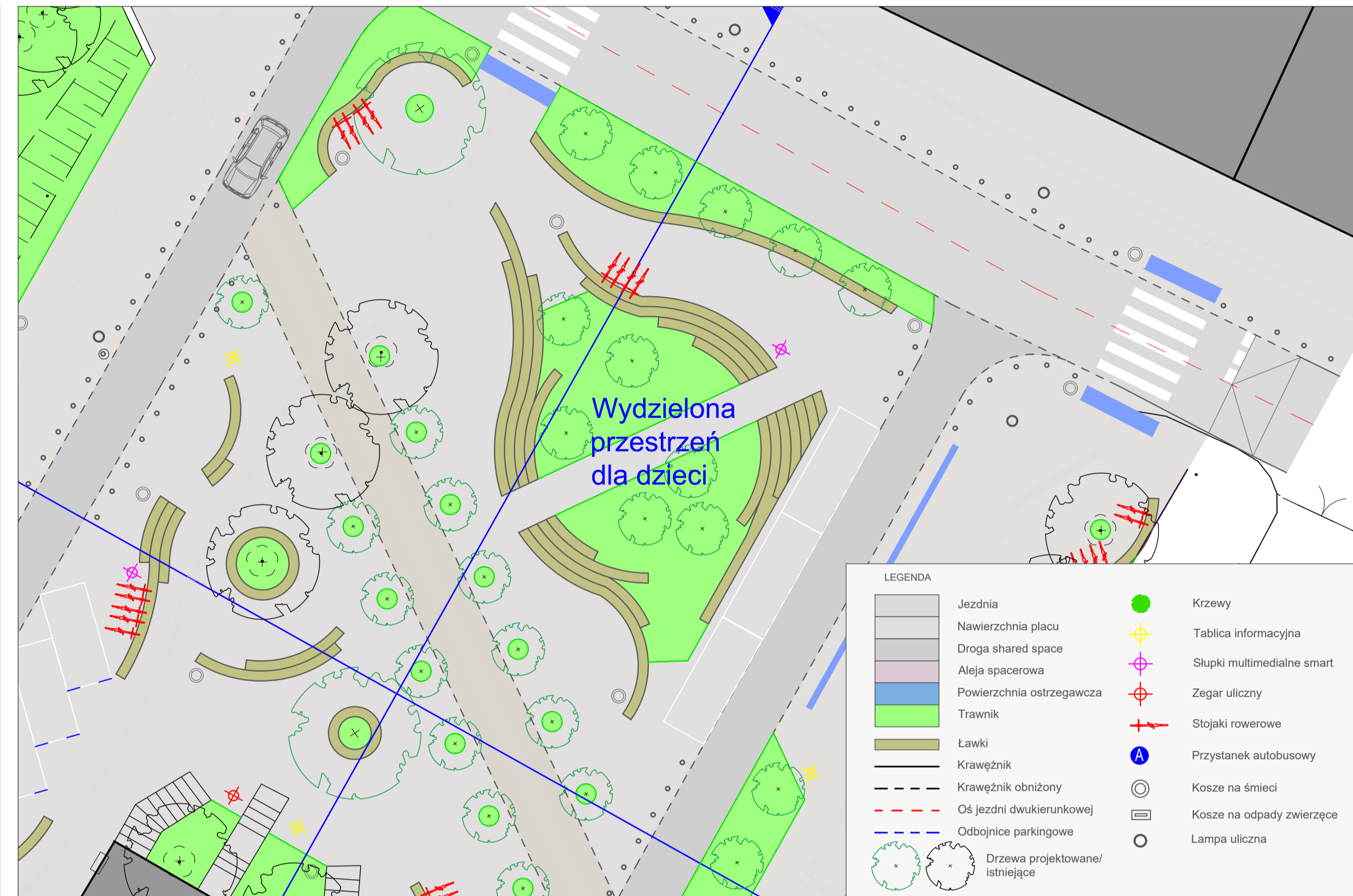
Plan sytuacyjny w skali 1:200