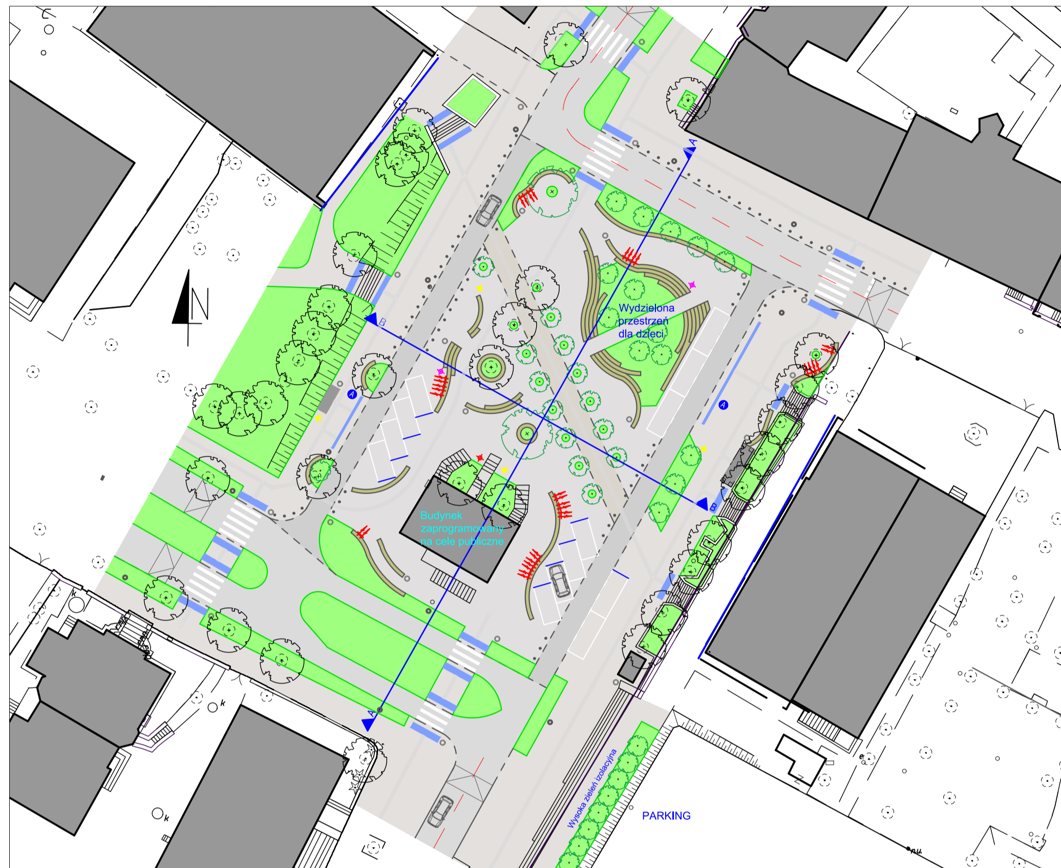
Plan sytuacyjny w skali 1:500

Przeistoczenie zastanego placu w przestrzeń współdzieloną rozpoczyna się od uspokojenia transportu kołowego w kierunku północ-południe jezdniami jednokierunkowymi. Powstała w ten sposób strefa stanowi połączenie skweru przy pobliskiej ulicy z miejscem handlu po przeciwnej stronie placu. Duża, otwarta przestrzeń uatrakcyjniona zielenią stanowi sprzyjające miejsce dla spotkań towarzyskich i spontanicznych wydarzeń lokalnych- kolidie ułożone, spiętrzone ławki mogą stać się amfiteatrem, a jego wewnętrzna przestrzeń przeistoczyć się w zielony skwerek zabaw dla dzieci. Możliwość wjazdu pojazdów do wnętrza pozwala na obsługę imprez food truckowych w idealnym do tego miejscu- pomiędzy zielenią, pasażem handlowym i miejscem zamieszkania z łatwym dostępem komunikacji miejskiej.