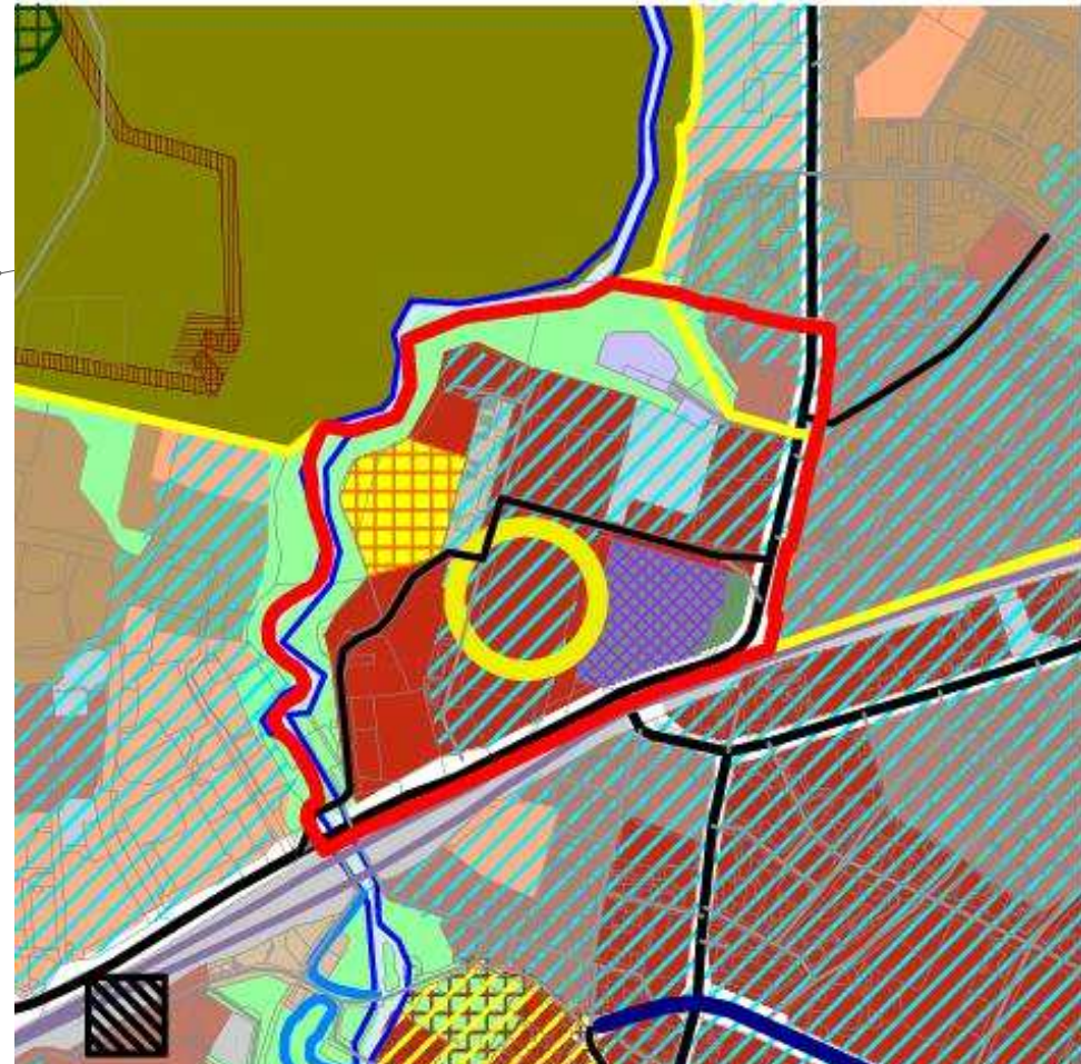
teren objęty planem

MAPA NR 1 stanowi załącznik nr 3 do Uchwały Nr XXXVII/660/13 Rady miasta Olsztyna z dn.15 maja 2013r.