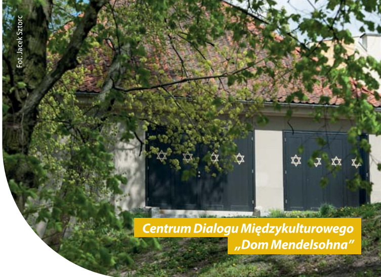
Centrum Dialogu Międzykulturowego „Dom Mendelsohna”