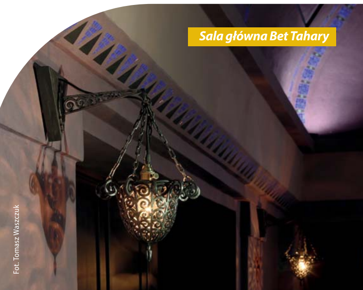
Sala główna Bet Tahary

Bet Tahara – dom oczyszczalni gminy żydowskiej